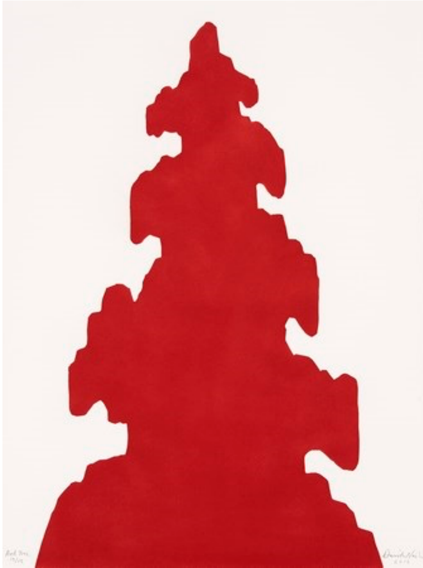
David NASH Red Tree , 2016 Pochoir 75.8 x 56.5 cm 15 ex. Encadrement