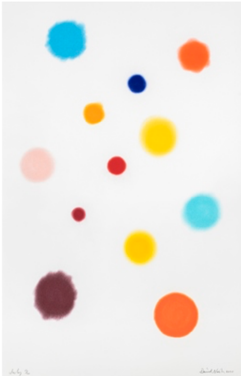
David NASH July, 2020 Pochoir 101,5 x 66 cm 30 ex. Encadrement