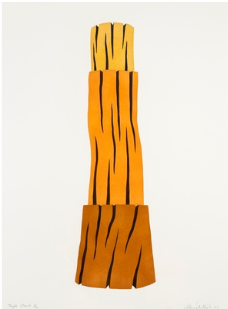
David NASH Triple Stack 2022 Pochoir 75,7 x 56,8 cm 30 ex. Encadrement