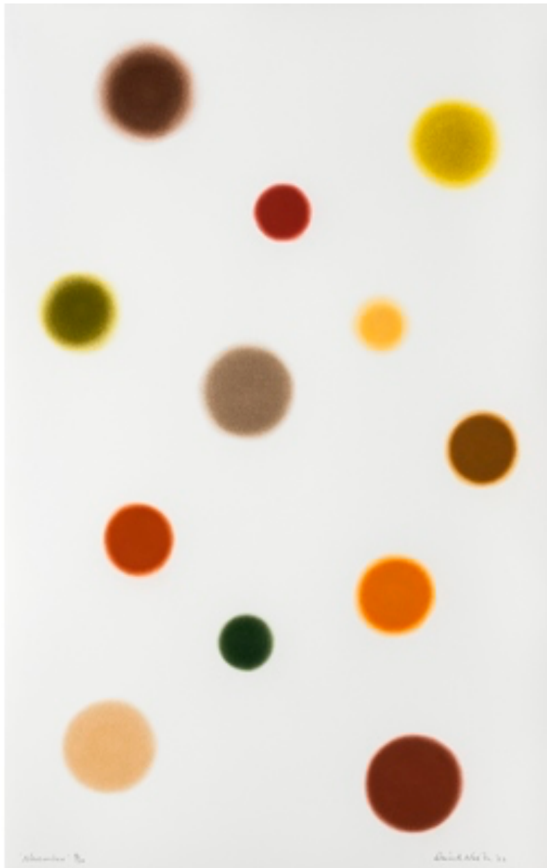
David NASH November, 2023 Pochoir 104 x 66 cm 30 ex. Encadrement