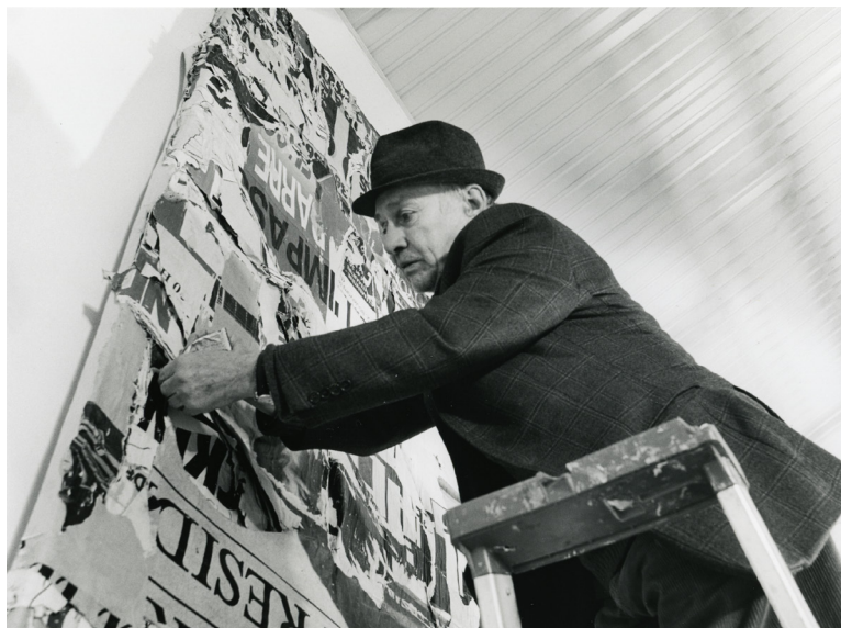
Jacques Villeglé - 2008

Jacques Villeglé, né à Quimper en 1926, a commencé en 1947, à Saint-Malo, une collecte d'objets trouvés : fils d'acier, déchets du mur de l'Atlantique... En 1949, il limite son comportement appropriatif aux seules affiches lacérées. Juin 1953, publication de Hépérile éclaté , poème phonétique de Camille Bryen rendu illisible à travers les trames de verre cannelé de son partenaire intellectuel Raymond Hains (1926 - 2005). Février 1954, le poète lettriste François Dufrêne les présente à Yves Klein, puis à Jean Tinguely et Pierre Restany, avec lesquels sera constitué, en avril 1960, à Milan, le groupe des Nouveaux Réalistes, après leur participation commune à la première Biennale des jeunes de Paris d'octobre 1959.